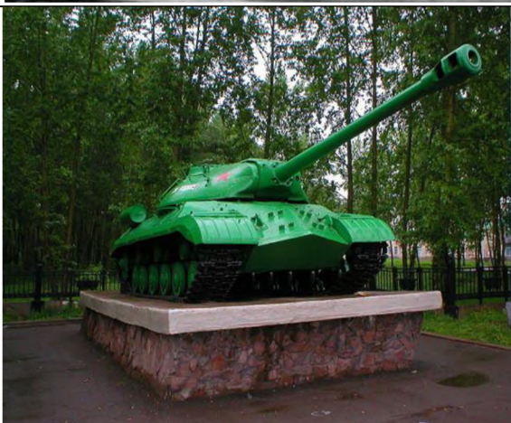
Памятник патриотам - ачинцам, внесшим свои сбережения на постройку танковой колонны «Красноярский рабочий» в годы Великой Отечественной войны (Площадь Победы)

В Ачинске воинам, умершим от ран, воздвигнут памятник, открыты мемориальные доски на зданиях, где в годы войны были размещены военные госпитали.