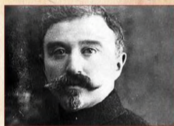
Леонтий Исаевич Патушинский